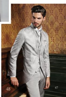
1. Montblanc - 2. Lardini - 3. Lozman - 4. Pollini - 5. Bigi Cravatte Milano - 6. Tiffany & Co. - 7. Andrea Versali - 8. Trussardi - 9. Lubiam 1911 Cerimonia - 10. Montblanc - 11. Serà fine silk - 12. Manuel Ritz - 13. Stefano Ricco - 14. Boggi Milano - 15. FeFé Glamour Pochette - 16. Canal - 17. Thomas Pina - 18. Fraga.com - 19. Paoloni